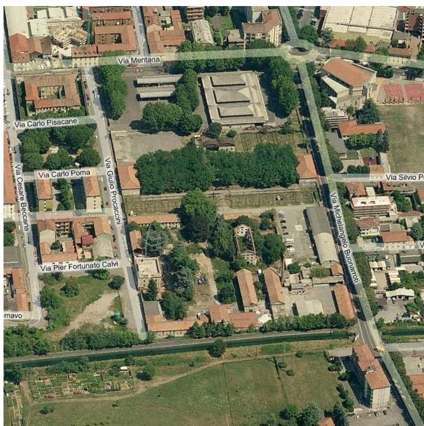
Immagine dell'area dell'ex macello