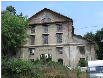
Uno degli edifici ormai in rovina

Vi si propongono spazi per i giovani, un ostello per la gioventù sul vecchio carcere (che però in seguito finì disgraziatamente in mani private), aree verdi, l'albergo per gli animali e la realizzazione di un Centro di Educazione Ambientale.