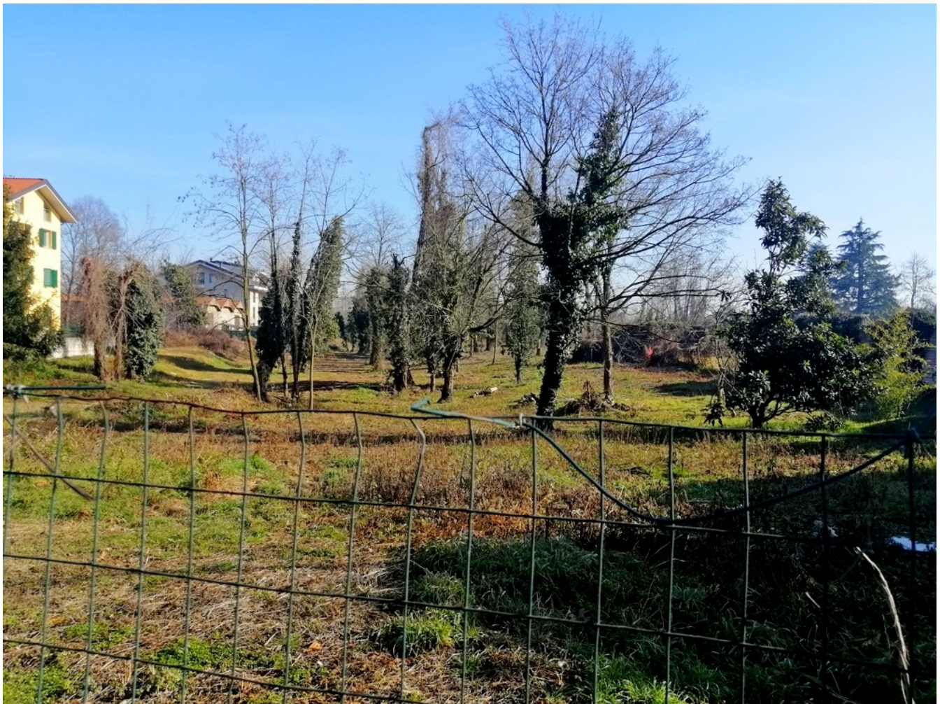
Via Lecco: lo spazio residuale del corridoio ecologico, sul confine tra Villasanta e Monza

Nell'arena si gettano suggerimenti senza valutarli seriamente, senza stimarne l'utilità e la redditività, senza considerare il complesso iter e la necessità di una verifica di fattibilità e senza un approfondito e mirato studio di viabilità e traffico merci che un simile progetto richiederebbe, dovendo essere contemplato in un piano d'area con il coinvolgimento di enti, azienda ferroviaria, istituzioni e investitori, tenendo nel dovuto peso anche l'opinione della cittadinanza.