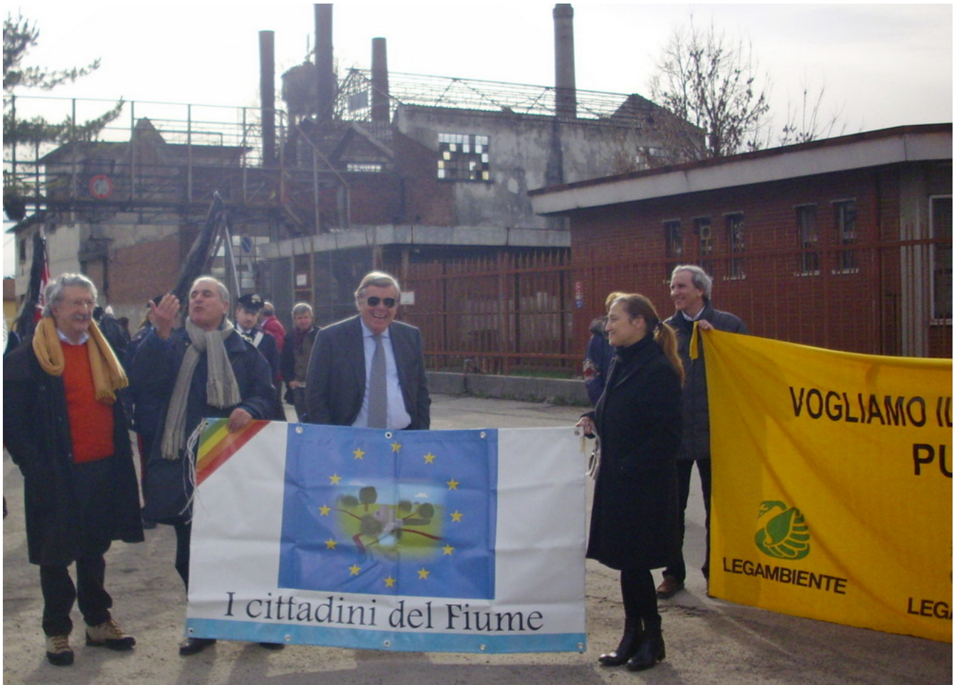
Sit-In di protesta-denuncia per lo sversamento di idrocarburi nel Lambro, 27 febbraio 2010

sposta nei due ambiti, anche grazie a un tunnel di connessione che passa sotto la via Lecco e la ferrovia.