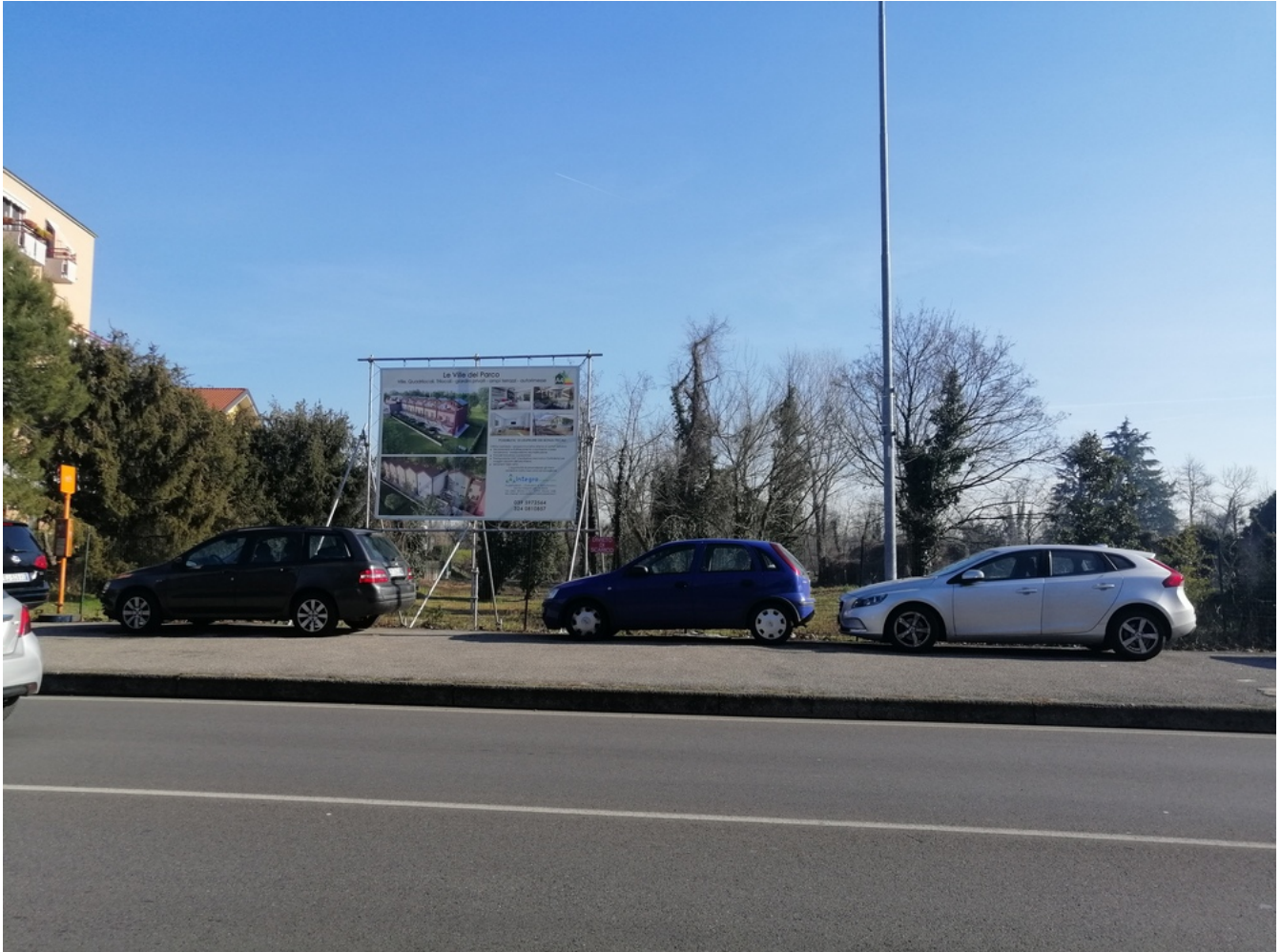
Via Lecco, il restante spazio, oggetto di edificazione

Nell'area ex Lombarda Petroli va confermata una robusta aliquota di recupero a verde, evitando una cementificazione sconsiderata.