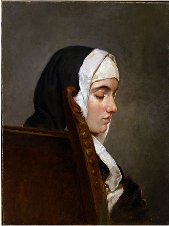
Francesco Hayez, La monaca , olio su tela, 54 x 40,5 cm, Milano, collezione privata In mostra al Serrone della Villa Reale di Monza

La mostra ha un allestimento semplice ed efficace, i lavori sono ben illuminati, forse un po' pochi. Ma questo è un aspetto delle mostre che divide i visitatori: c'è chi preferisce un numero limitato così da poterli apprezzare uno per uno con la dovuta attenzione e chi invece vuole l'abbondanza, valuterete voi stessi recandovi al Serrone.