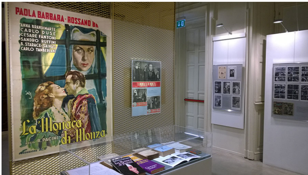
Materiali in mostra ai Musei Civici di Monza