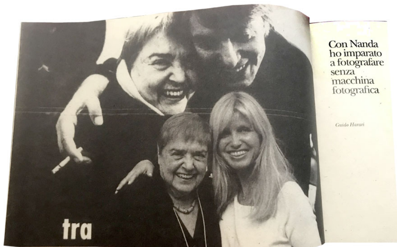
Dal libro "Fernanda Pivano. Viaggi Cose Persone".