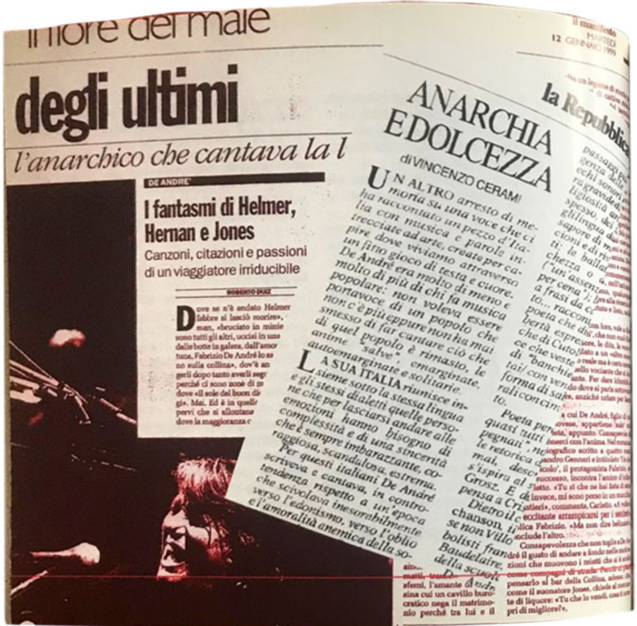
Una delle pagine interne del libretto.

Interno del pieghevole della serata FABER organizzata a Monza nel 2002.