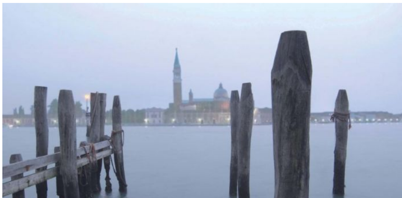
Briccole a Venezia

I Riva vantano collaborazioni con diversi designer di fama internazionale