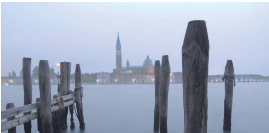
Briccole a Venezia