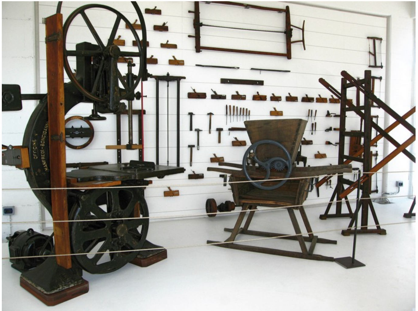
Museo del Legno a Cantù

Pensando al futuro e ai giovani, Riva 1920 inaugura nel 2001 il Museo del Legno . Per tramandare e non dimenticare che il legno è una risorsa rinnovabile, ma non infinita e solo un uso consapevole e una corretta politica di integrazione del patrimonio arboreo, può garantire in futuro un giusto equilibrio dell'ecosistema. Cultura, design e sensibilità sociale sono divenuti da allora parte fondamentale dell'attività di Riva 1920. Da sempre i prodotti raccontano una storia alle generazioni future: produrre con onestà per tramandare.