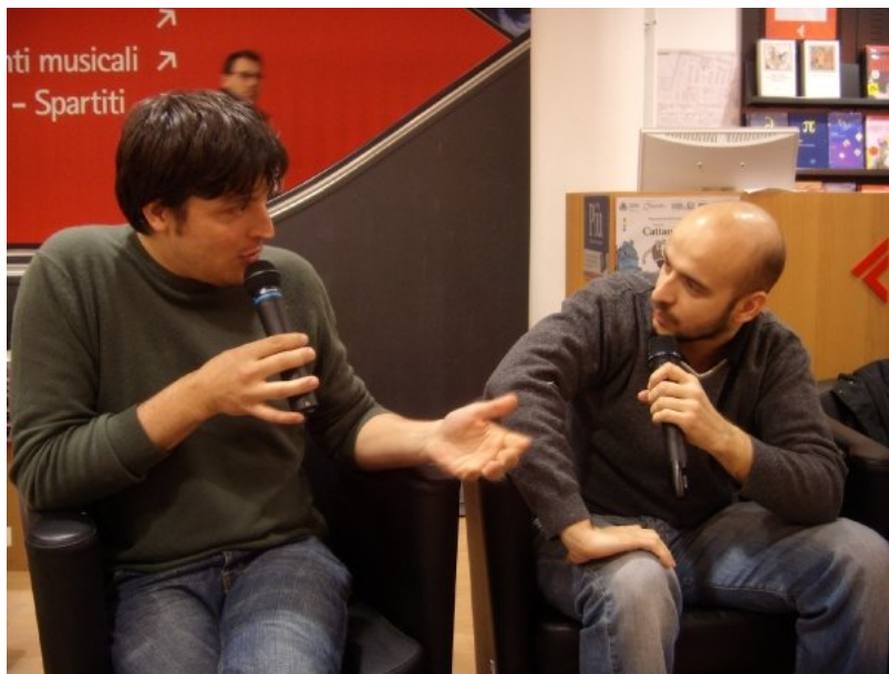
Baronciani e Cattani

Il tradizionale appuntamento del Comune di Monza con i giovani del territorio inizia alle 18.30 del 1 dicembre all'Urban Center.