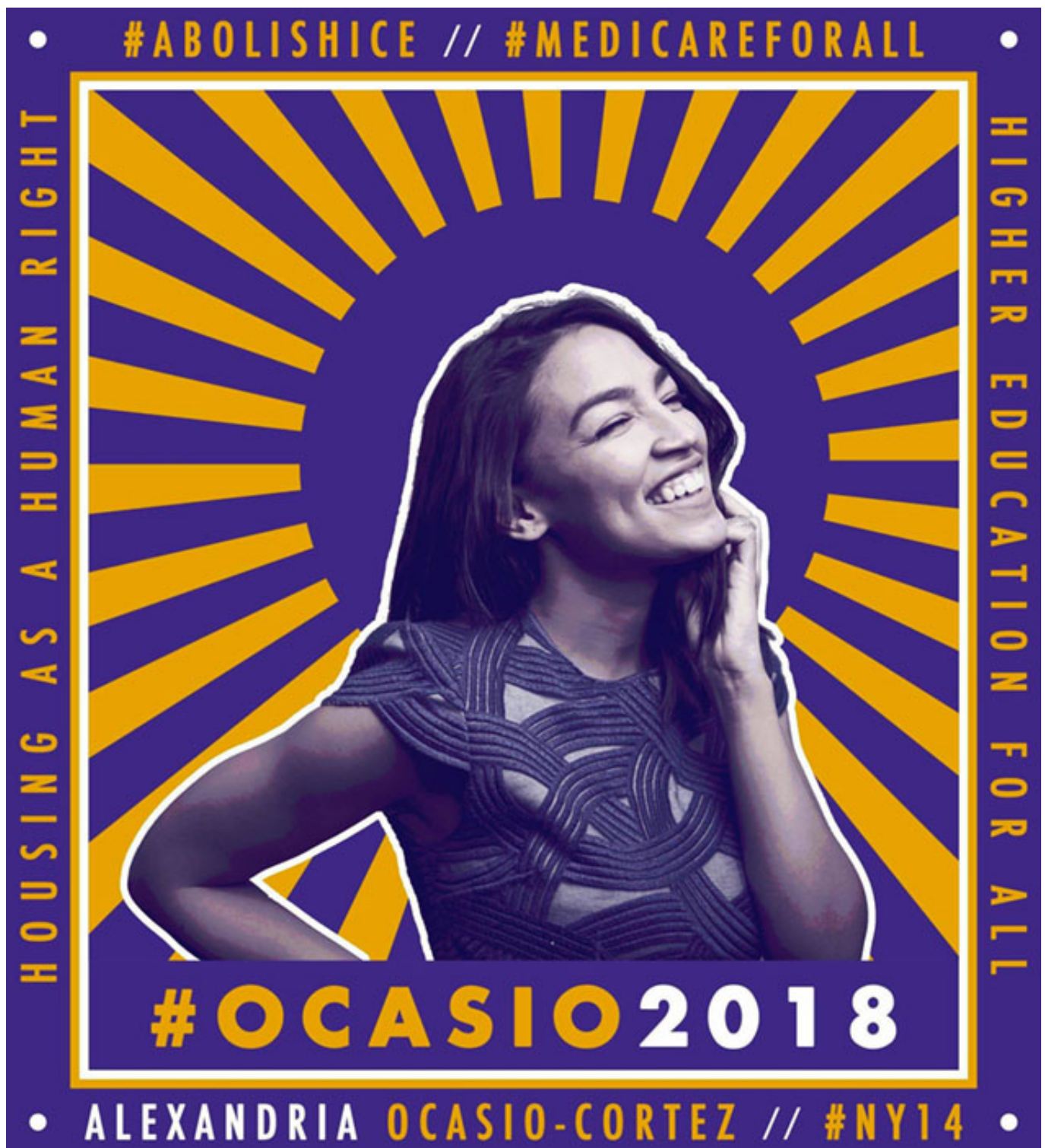
Uno dei manifesti elettorali di Alexandria Ocasio Cortez

Nata e cresciuta nel Bronx, americana di prima generazione di una modestissima famiglia di origini portoricane , laureata alla Boston University dove ha fatto uno stage all'Ufficio Immigrazione del Senatore Ted Kennedy, attivista sandersiana nel 2016, insegnante e contemporaneamente cameriera, Alexandria Ocasio Cortez ha vinto (57% contro 42% dei